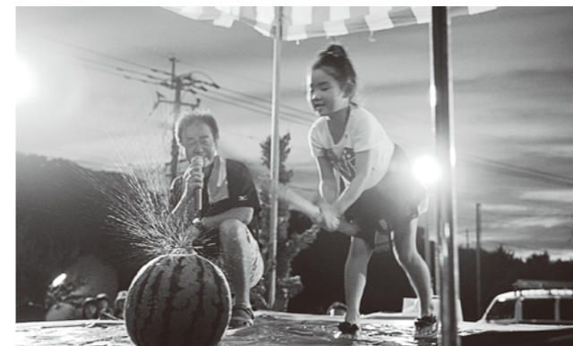
スイカ割り（=上津深江集会所、13日）

ペーロン大会は、各テレビ局も取材するなか坂瀬川の9地区（チーム）が参加。多くの帰省客も選手として出場しました。富岡地区では、子どもから高齢者までが富岡小運動場でグラウンド・ゴルフを楽しみました。