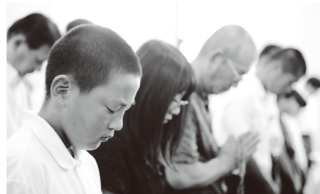
黙とうする苓北中学校生徒