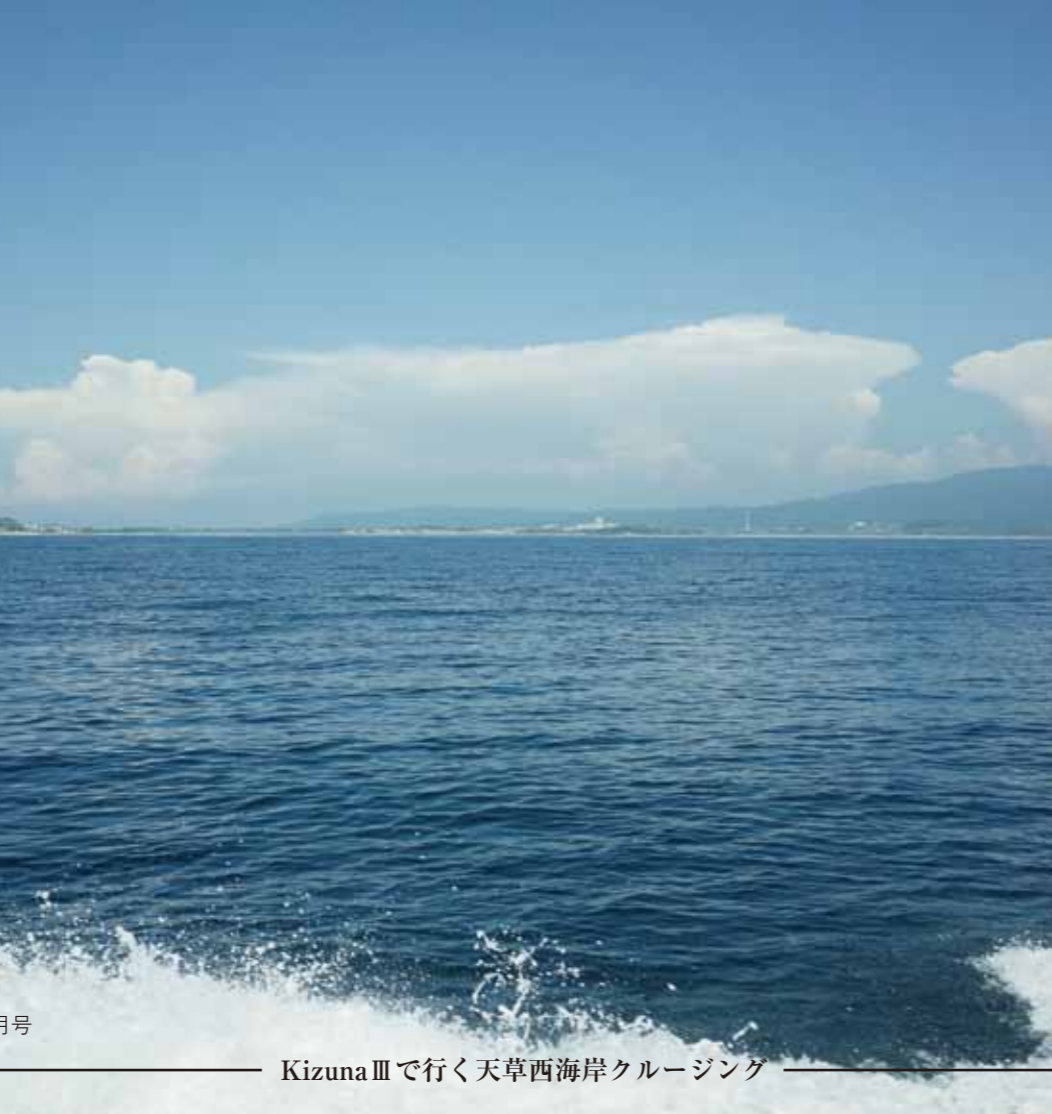
KizunaⅢで行く天草西海岸クルージング