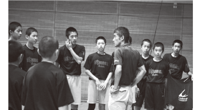
試合前、監督の話を聞く男子ハンドボールの選手ら