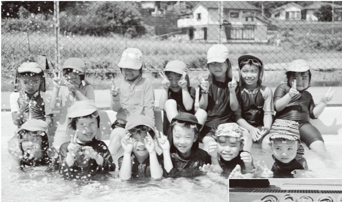
手作りの船を浮かべ水遊びを楽しんでいます。夏ならではの遊びを毎日元気いっぱい満喫中です。