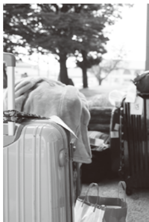
キャリーバッグが並ぶ

10日間の研修を終えた8人の生徒と引率2人は8月10日、無事帰国し役場では保護者らが出迎えた。研修生は9月に、自ら体験した研修内容を報告する。（報告会）