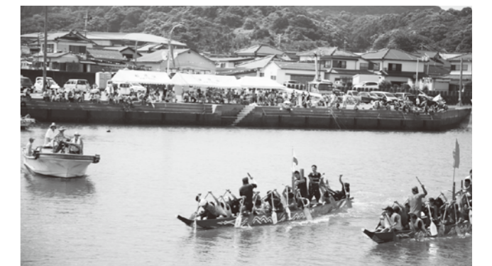
多くの観客が見守るなかスタート（=坂瀬川漁港、14日）