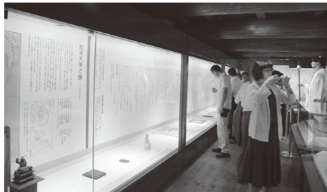
多くの展示物がならぶ（※通常は撮影禁止）