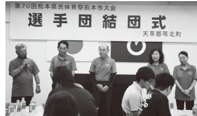
決意表明をするグラウンド・ゴルフ代表

本年9月12日と13日に熊本市で開催される第70回熊本県民体育祭熊本市大会の天草郡（苓北町）選手団結団式は、7月30日に役場大会議室で行われました。