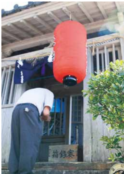
妙見社例祭(8月7・8日) =都呂々1区=

発行/菘北町役場 〒683-2503 熊本県天草郡菘北町志岐660番地 ☎0969-35-1111 ☎0969-35-2454 ホームページ http://reihoku-kumamoto.jp/ 発行日/平成27年8月21日 ■編集/総務課 ■印刷/株印刷センター