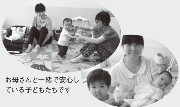
お母さんと一緒に安心している子どもたちです