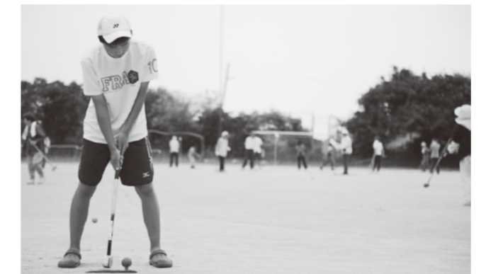
富岡小学校で行われたグラウンド・ゴルフ大会（=14日）