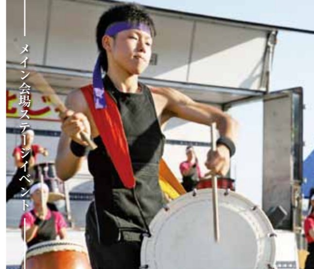
メイン会場ステージイベント