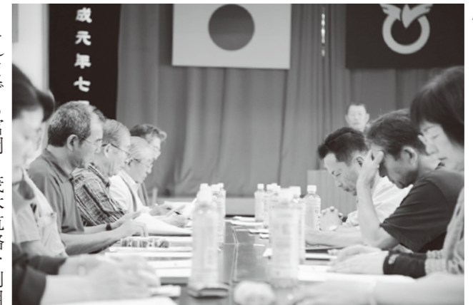
会議の様子(=富岡公民館)

これまでも富岡・茂木航路を利用して、生活・文化・産業・観光などの面で友好な関係が築かれてきた両市町ですが、近年の交通形態の移り変わりにより、以前に比べ交流人口が減ってきています。 長崎の教会群とキリスト教関連遺産の世界遺産登録への期待が高まるなかで、高速船で45分という利便性を活かして、人・産業・観光の交流を今一度深め、両市町のさらなる振興を目的として今回、「長崎・荅北交流倶楽部」の