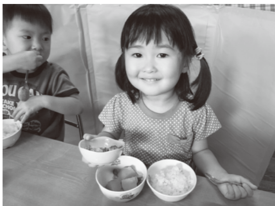
国照寺保育園のおともたち