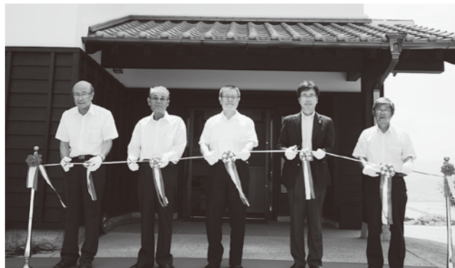
テープカットでオープンを祝う

入館料は大人300円、小人100円、幼児は無料となっています。休館日は毎週木曜日で、祝・休日の場合は翌平日が休館となります。