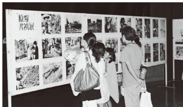
パネルに見入る親子づれ

「親と子の平和のつどい」は8月7日に志岐集会所であり、親子づれなど約80人が戦争の悲惨さや平和の尊さについて学びました。