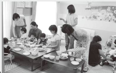
みんなで作ったピザをおいしくたべます。

また、これから夏の疲れがでてくる時期です。生活リズムを見直したり、バランスのとれた食事をとるなどして、元気に過ごしましょう。