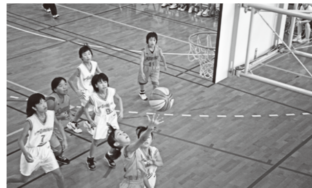
シュートを放つ富岡小選手