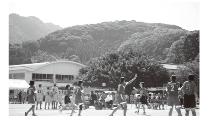
苓北中ハンド部は新チームで始動した