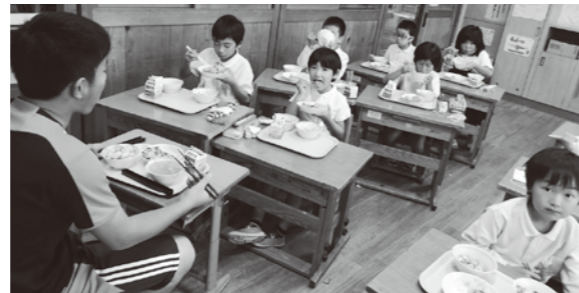
給食の様子(志岐小学校)