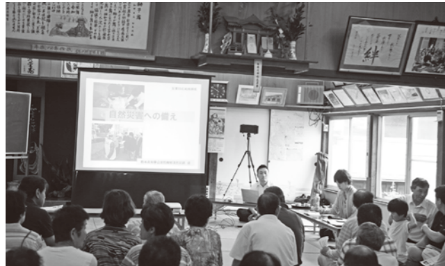
スライドを見ながら約90分、防災を学ぶ

県内の全自治会のうち約8割が設立している“自主防災組織”。県では災害対応ができる組織を育成するためモデル地区を募集し、応募した和田区が選ばれ第1回目の講座が開かれました。次回からは、災害図上訓練、実動訓練などが予定されています(全4回)。