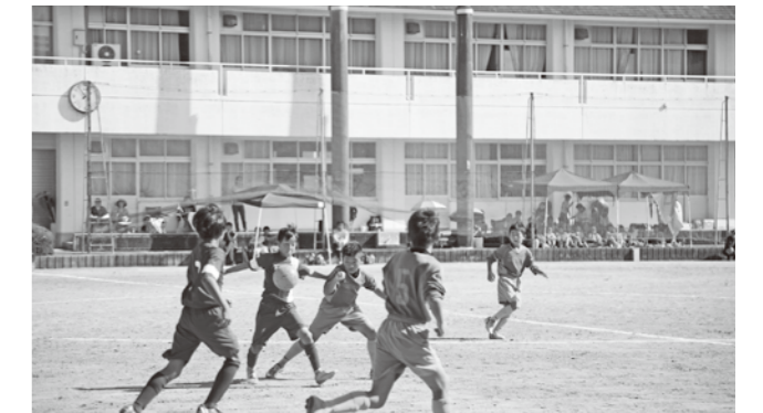
現在、小学生のサッカーは8人制が主流