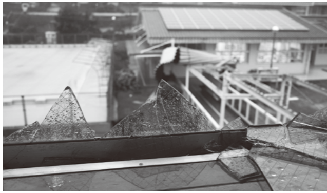
渡り廊下の屋根が吹き飛び体育館の窓ガラスを破損(=富岡小、25日7時頃)

8月24日▼午後5時、自主避難所開設(避難者数最大=39人、24日)▼午後6時46分、暴風・波浪警報発令(25日13:38同解除)▼午後10時48分、大雨・洪水警報発令(25日10:38同解除)▼最大瞬間風速46.7m▼雨量87mm▼倒木…7カ所(25日)▼落石…1カ所▼ケーブル類の断線・垂れ下がり…町内各所▼停電による水道施設異常▼公共施設…屋根、窓ガラス破損数カ所▼停電…最大1,000戸/5,200戸(九州電力株情報、27日全復旧)▼人的被害なし