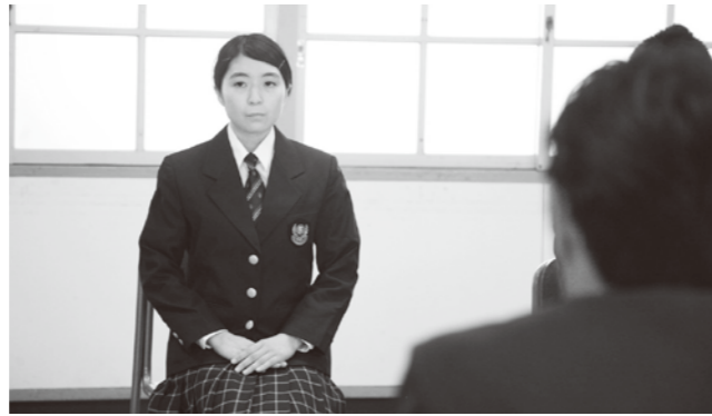
面接官の言葉、聞き逃さずフル回転。

西天草ロータリークラブによる就職模擬面接は9月9日に苓洋高校で行われ、同校3年生就職希望者20人が本番さながらの面接を経験しました。