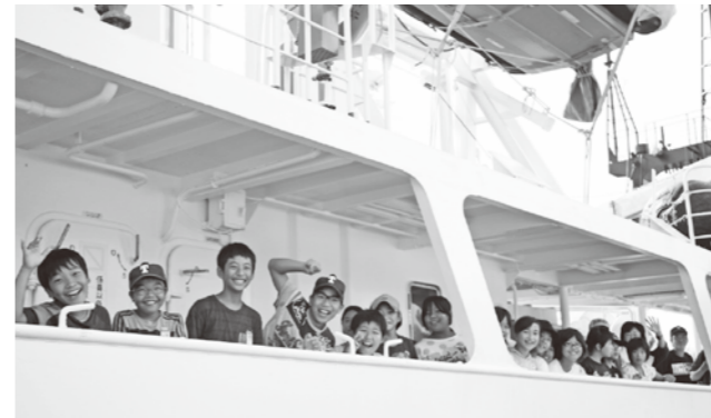
笑顔で出航した富岡小学校6年生

富岡小学校6年生(19人)は8月20日と21日の2日間で、苓洋高校の実習船「熊本丸」による航海を体験しました。