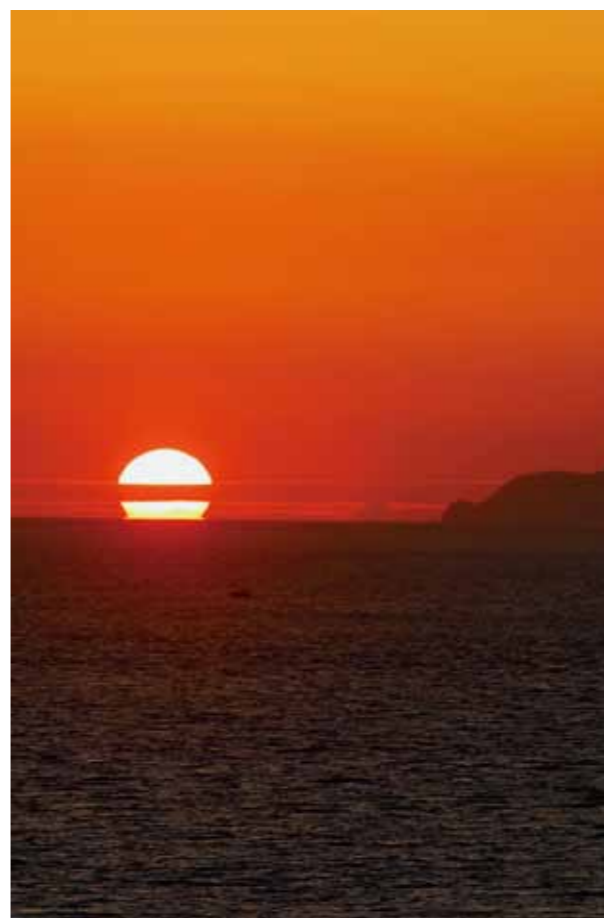
天草灘に沈む夕日 (=白岩崎から、9月11日18:30頃)

3回目となった茶北タヤけマラソン。天草西海岸を走る本大会は、交流人口増加への取り組みとして2013年にスタートしました。本年は、11月7日(土)に町制施行60周年記念事業として開催します。コースはハーフ、10キロ、4キロ(ファミリー部新設)の3部門。今年も三菱重工と旭化成からゲストランナーが参加予定です。