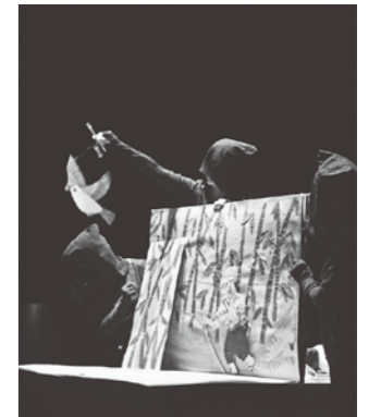
黒子があやつる手作り紙芝居