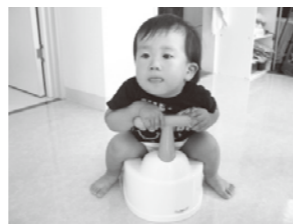
おしっこできるかな？

A：まずは、トイレに慣れることから始めてください。朝目覚めたあとや午睡のあとなどが、おしっこの出やすい時です。機嫌のいい時をみてトイレに座らせてみてください。くりがえし、トイレに座ることによって、少しずつトイレでおしっこが出るようになります。出たらいっしょに喜んでやることによりトイレに行くのも楽しくなります。