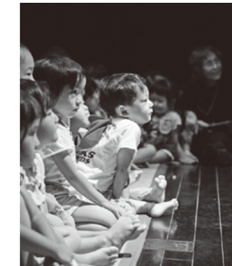
紙芝居に見入る園児