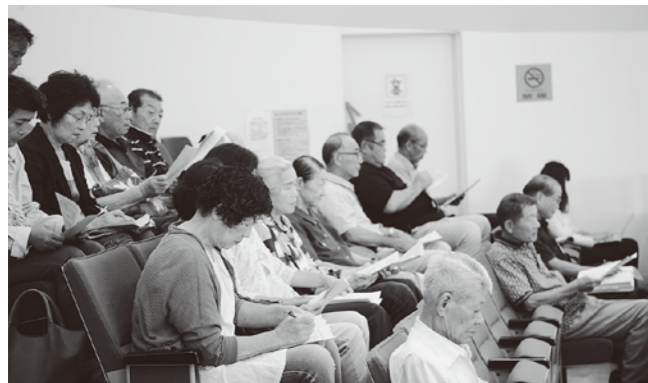
審議に聞き入る傍聴者