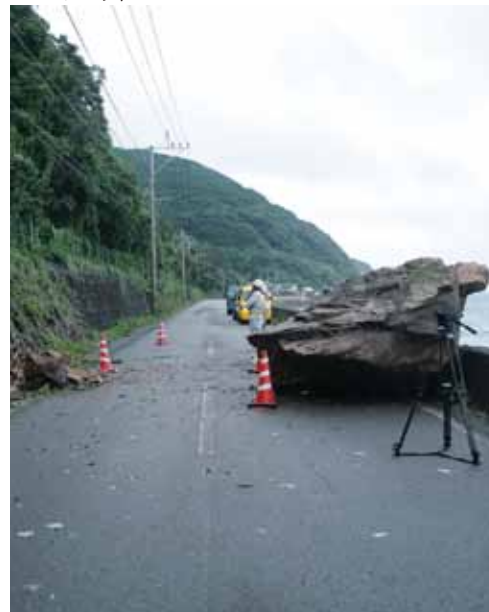
巨大落石。降り続いた雨の影響と思われる