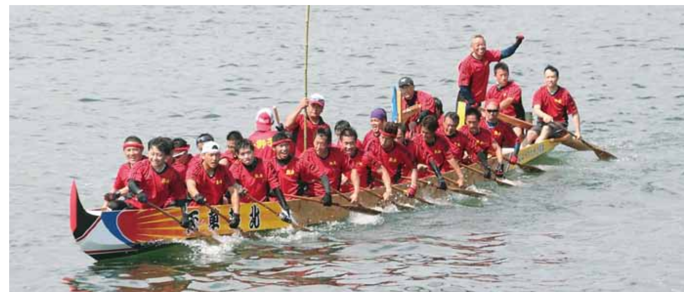
長崎で荅北旋風を巻き起こした都呂々若獅子会