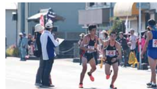
懸命にタスキをつないだ荅北中