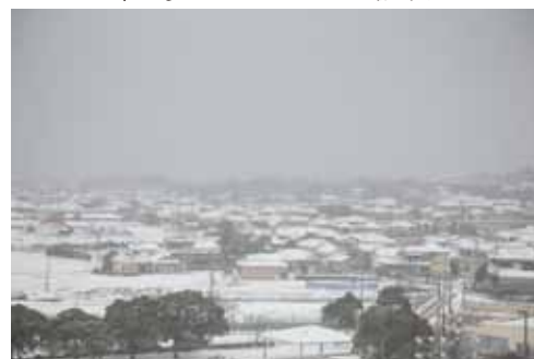
1月25日、志岐地区の様子