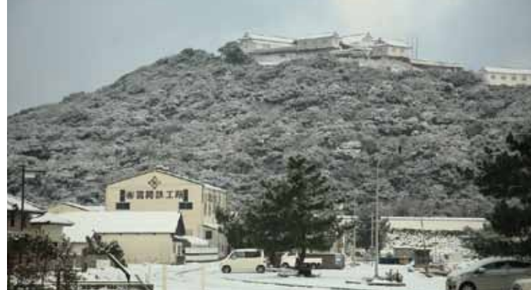
大雪で真っ白に染まった 富岡城