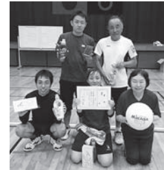
2位 (エガちゃんピンA) 3位 (天草慈恵病院)

各種大会結果 秋季ミニバレーボール大会 (10月28日 体育センター) ■優勝 チームマンデー1号