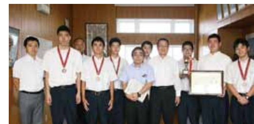
荅洋カッター部。全国3位を報告に