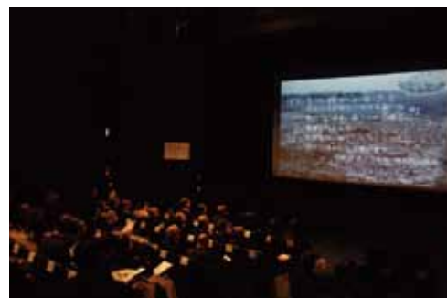
60年の歩みをスライドで振り返る