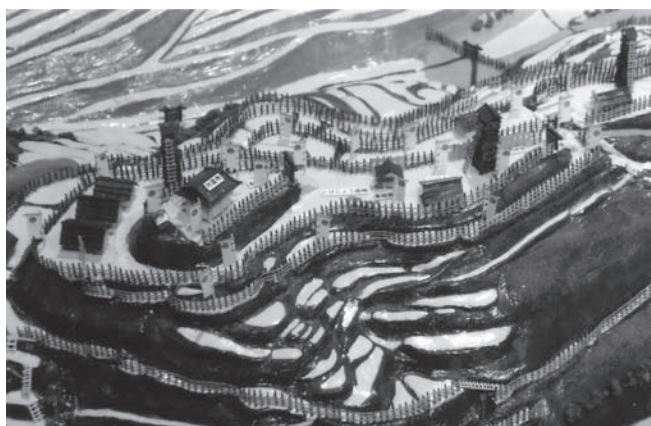
志岐城跡模型 (富岡城二の丸・苓北町歴史資料館)

〔検証〕一の丸は、当然、本丸のことです。出丸も、場所が分かりますが、三の丸は、伝承にありません。しかし、谷間の急