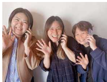
わたし でんわ で 私たちが電話に出ます！