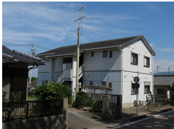
1F低層耐火構造+2F木造（階段側）