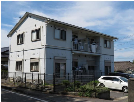
1F低層耐火構造+2F木造（ベランダ側）