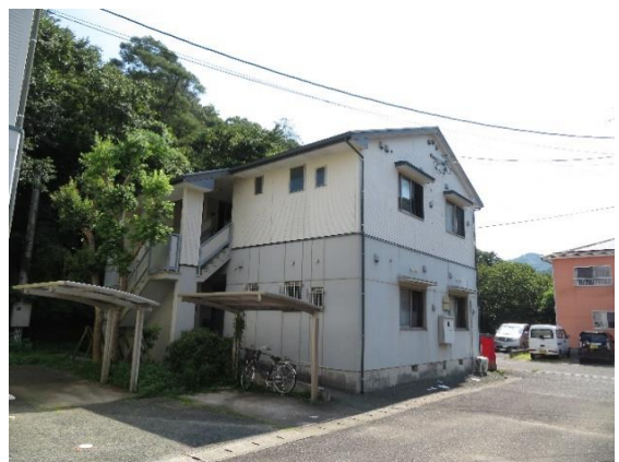
1F低層耐火構造+2F木造（階段側）