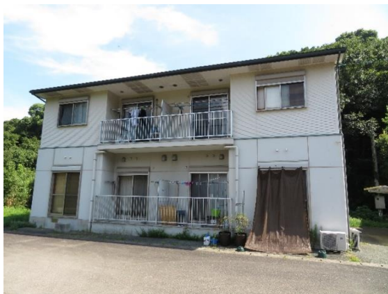
1F低層耐火構造+2F木造（ベランダ側）