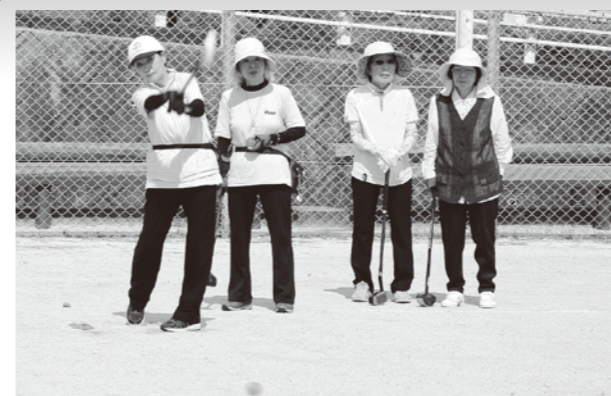
▲渾身のティーショット

真夏の太陽がキラキラと照りつける中、参加者たちはグラウンド一杯に作られた各コースで一斉にスタート。皆さん普段からグラウンドゴルフに親しんでいるだけあって、プレー中は暑さなど関係ない様子。真剣な表情でホールポストをめがけて、渾身の一打を放っていました。会場には、一打一打に一喜一憂しながらプレーを楽しむ皆さんの笑顔があふれていました。