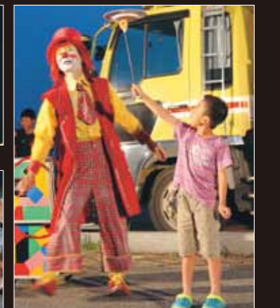
ちゃちゃ丸もビックリの皿回し

夏の一大イベント、苓北じゃと祭のステージイベントと花火大会が7月19日、富岡港駐車場を会場に開催され、多くの人でにぎわいました。祭りの始まりは熊本丸体験乗船。青く晴れた空の下、76人が約1時間30分の船旅を楽しみました。また第2便には、くまモンが乗船。愛嬌たっぷりのくまモンに皆さん大喜びでした。そして午後6時、ステージイベントがスタート。オープニングを飾ったのは唐津市の和太鼓「竜童」の皆さん。勇壮なバチさばきと豪快な和太鼓の音で会場を震わせ、祭りに花を添えました。太鼓の余韻が残る中、次に始まったのはニュースポーツ、アジャタ大会。苓北医師会病院が参加9チームの頂点に立ち、大会2連覇を果たしました。日も暮れ始めた午後7時40分、奇抜な衣装を身にまとったピエロ、ちゃちゃ丸が登場。ちゃちゃ丸がジャグリングやバランス芸などを披露すると、会場は皆さんの笑顔と笑い声に包まれました。そして午後8時、大音響のなかNOSANオールスターズのライブがスタート。懐かしの名曲や最新のJ-POPで祭りを盛り上げました。この日の最後を飾ったのは3千発の花火でした。会場の皆さんのカウントダウンとともに大小色とりどりの花火が次々に打ち上げられ、苓北の夏の夜空に咲き乱れました。