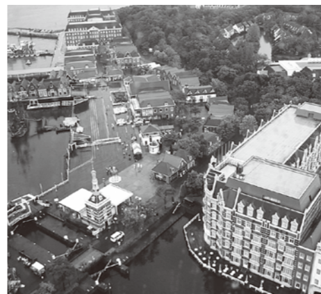
ハウステンボスの町並み

こんにちは。今回は親子ふれあい旅行で、長崎ハウステンボスに行きました。これまでこの旅行で、かごしま水族館、阿蘇ミルク牧場、長崎バイオパーク、グリーンランドなどさまざまなところに行きました。僕は小さいころから参加していますが、来年からは、高校生になるので行けません。今年の旅行が最後の旅行でした。すごくいい思い出になりました。とくにトリックアート展がおもしろかったです。とてもいい経験になったし、とても楽しかったです。