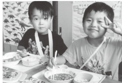
富岡保育園のおともだち