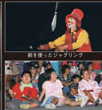
剣を使ったジャグリング