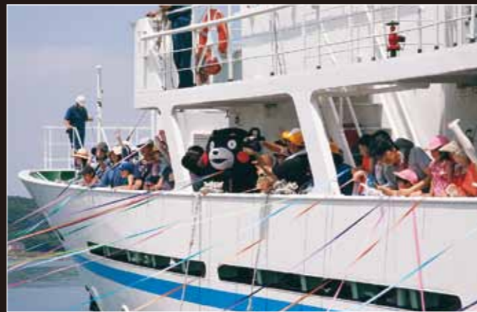
くまモンと一緒に熊本丸体験乗船