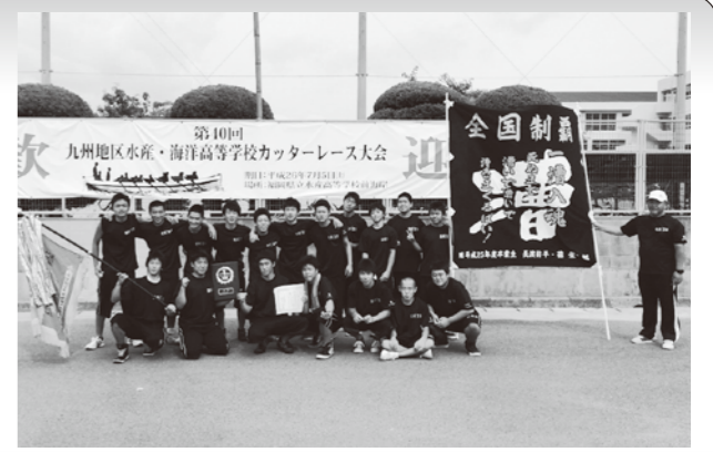
▲九州大会で優勝した苓洋高校カッター部の皆さん

全国大会は7月23日から25日にかけて愛知県で開催。苓洋高校は伝統の水産魂と「一漕入魂」の精神で力漕するもあと一歩届かず惜しくも準決勝敗退。3位入賞には届きませんでしたが、生徒たちのがんばりが認められ見事「敢闘賞」を受賞しました。