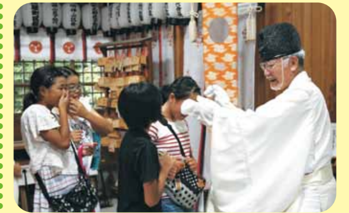
河童の手で頭をなでる「頭なで神事」は水難よけを願う