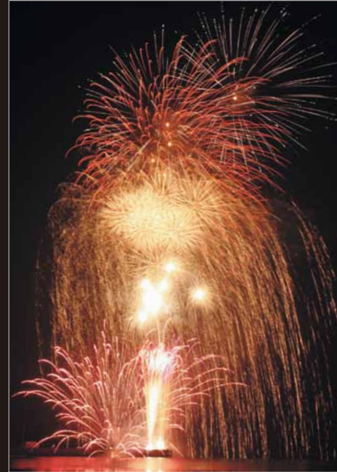
夜空に咲き乱れる花火