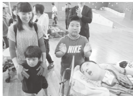
上の2枚は苓北じゃるじゃるカーニバルの様子