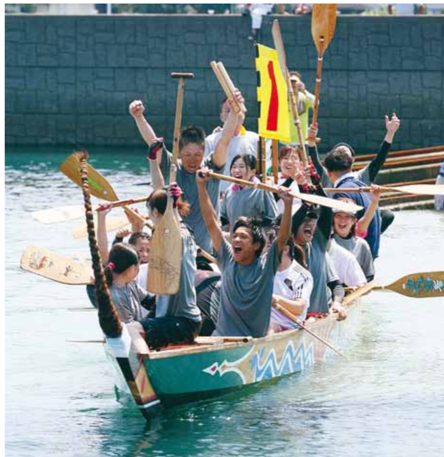
W・Wクリックに訪れた歓喜の瞬間! 男女混成の部初優勝!