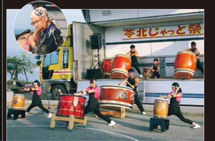
唐津市の和太鼓「竜童」の皆さん