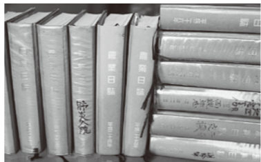
昭和48年から続けてきた農業日誌