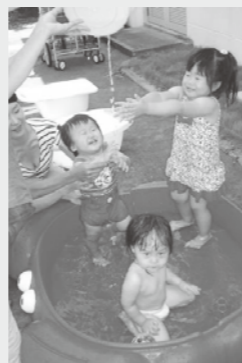
お水遊びは楽しいよ