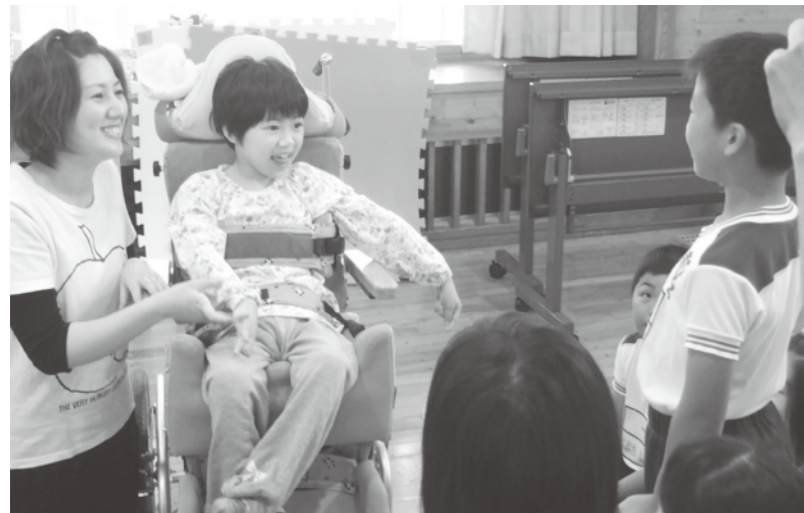
交流および共同学習の様子