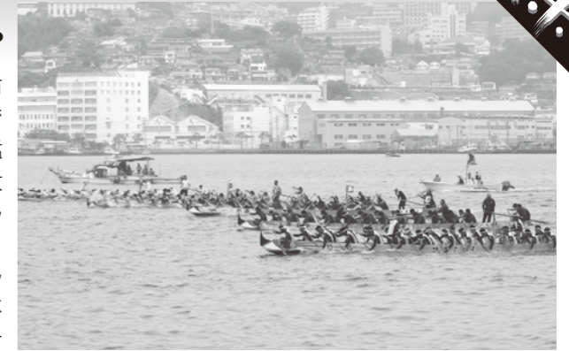
▲熱いレースが繰り広げられた長崎ペーロン選手権大会

各地の強豪がひしめく中、都呂々若獅子会は勝利を目指してチーム一丸となって力漕。惜しくも勝利を手にすることはできませんでしたが、応援する方も思わず力が入る熱いレースを見せてくれました。