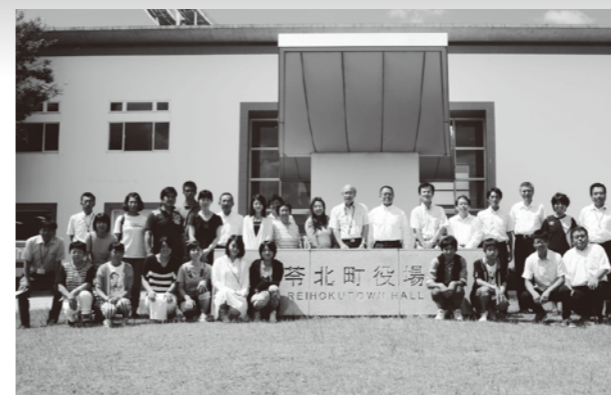
▲オーストラリアへ旅立つ前の研修生と関係者の皆さん

今回参加したのは、町内中学校の生徒8人と引率者2人。研修生は期間中、マジー市民の家庭にホームステイしながら現地の学校に通い、現地の子どもたちと触れ合いながら語学研修や文化交流を図りました。