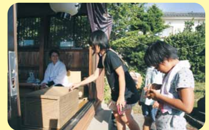
お賽銭をあげて参拝する子どもたち