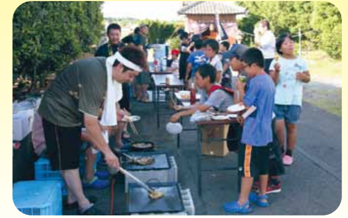
出来町青年団がかき氷や焼きそばなどを振る舞い大にぎわい