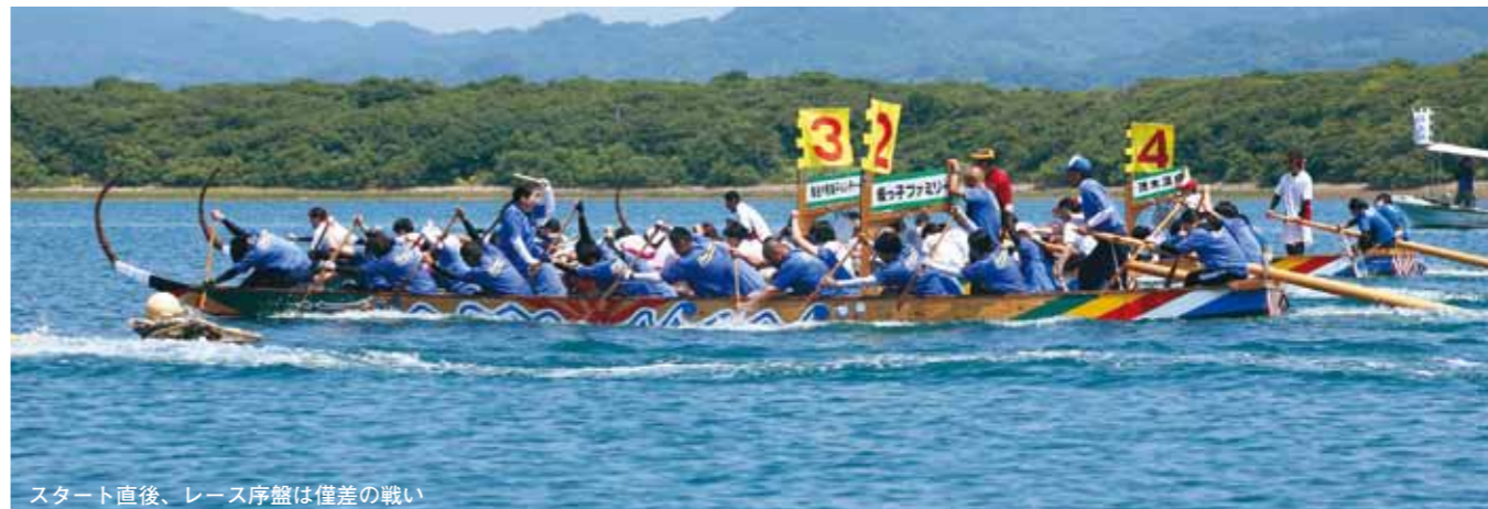
スタート直後、レース序盤は僅差の戦い