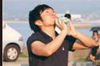
アジャタの玉を手に真剣にカゴを狙う参加者