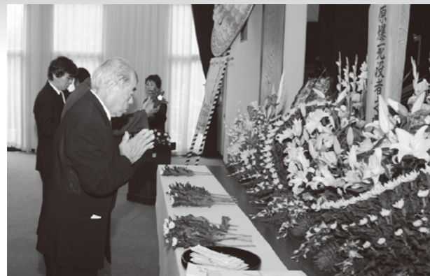
▲祭壇に手を合わせる参列者