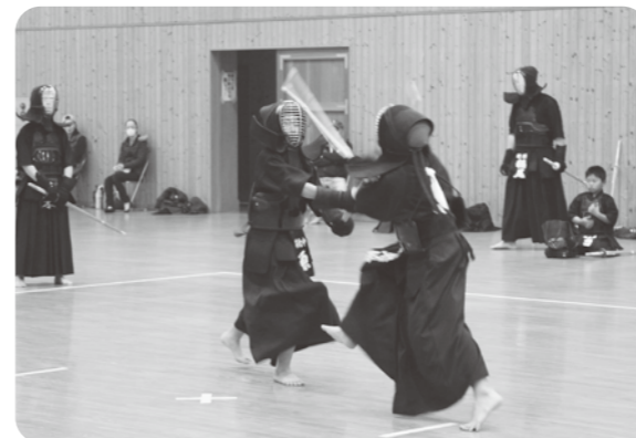
少年武道発表大会の様子（本年3月開催）