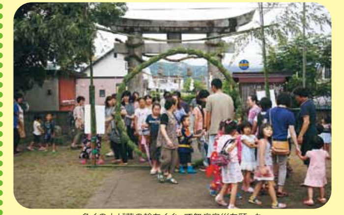
多くの人が茅の輪をくぐって無病息災を願った