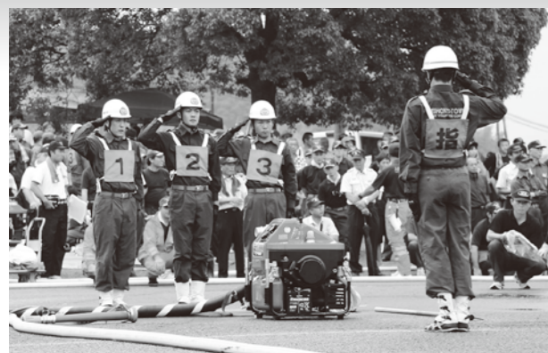
▲操法競技を終えて敬礼する操作員