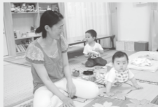
日々成長が見られてうれしいな