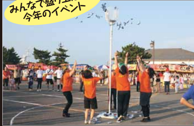
アジャタ（玉入れ）大会