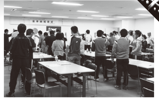
▲大躍進を目指しジュースで乾杯する選手団

天草郡は昨年、一昨年と2年連続で躍進賞を受賞。選手の皆さんは、今大会もさらなる大躍進を目指して日々練習に汗を流しています。町民皆さんの応援をよろしくお願ひします。