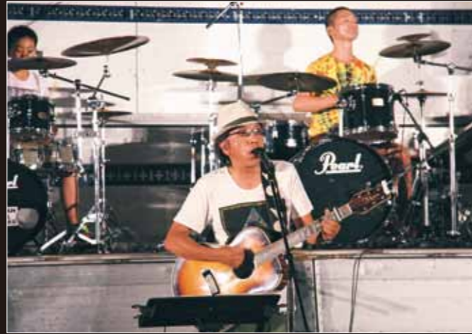
祭りを盛り上げたNOSANオールスターズ