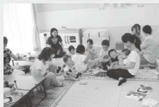
たくさんの参加者でにぎわいました