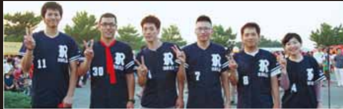
2年連続優勝の苓北医師会病院