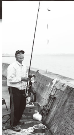
穴場、志岐漁港!! 1回5匹