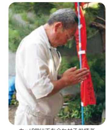
カッパ堂に手を合わせる参拝者