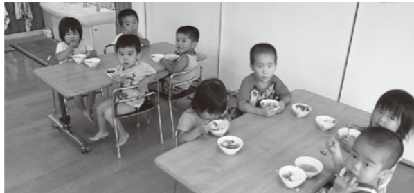
都呂々保育園のおともだち