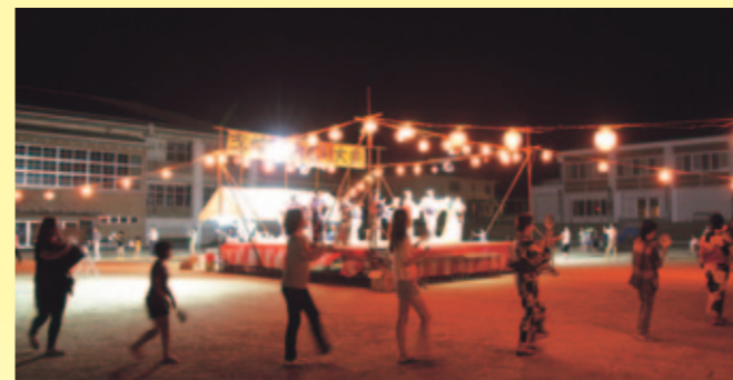
幻想的な提灯の明かりの中で踊る志岐地区盆踊り