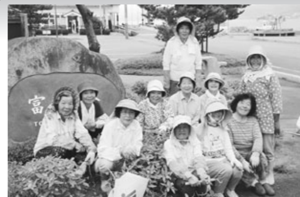
▲清掃を終えて一息つく漁協女性部の皆さん

教室には、町内の小学生約70人が参加。ドリブルの練習やミニゲームでプロの技を学びました。また、ロアッソ熊本のマスコット「ロアッソくん」と熊本日日新聞社マスコット「ぶれすけ」も遊びに来てくれ、子どもたちも大喜びでした。