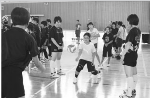
▲バレーボールを楽しむ苅北町の小学生

苅北町バレーボール協会は9月7日、バレーボールの普及と競技力の向上を図ることを目的に、苅北町体育センターでバレーボール教室を開催しました。今回バレーボールの指導にあたったのは、熊本信愛女学院高等学校バレーボール部の皆さん33人。同高校は、今夏の全国高校総合体育大会で準優勝した県下屈指の強豪校。会場には、全国レベルの技を学ぼうと町内小学生や町内外の中学生が集い、高校生と一緒に汗を流しました。また会場には、練習の方法や指導方法を熱心に学ぶ学校や地域の指導者の姿もありました。