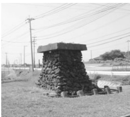
② 【志岐炭鉱石碑台座】

女性の乳房の形に似ていることから「おっぱい岩」と呼ばれている海岸に転がる大きな岩。西川内の海岸に露出する坂瀬川層の中にあつた硬い塊が風化・浸食により取り残されたもの。