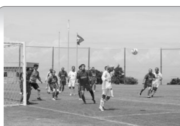
▲ゴール前でボールを争う選手たち