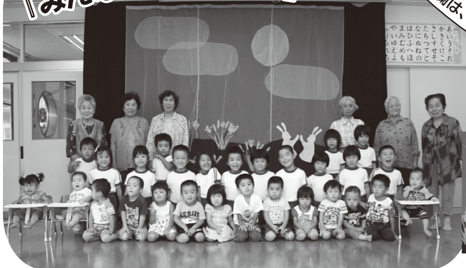
お月見会、楽しかったよ(*o*)v

十五夜にちなんでお月見会をしました。歌を歌ったり、パネルシアターのお話を見たり、またメインの綱引きでは大いに盛り上がり、楽しいお月見会となりました。