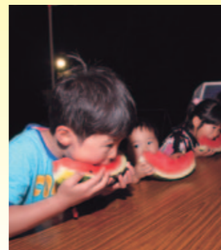
スイカの早食い(上津深江)