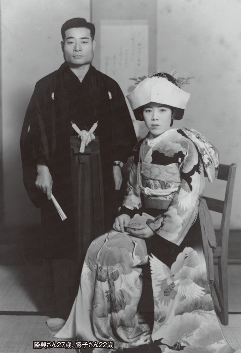
隆興さん27歳、勝子さん22歳