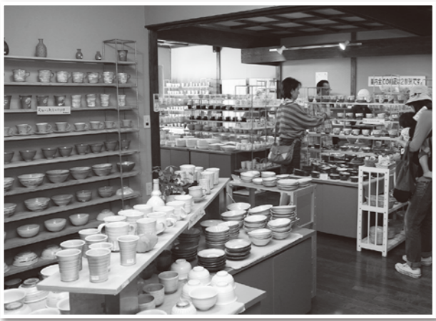
昨秋の窯元めぐり