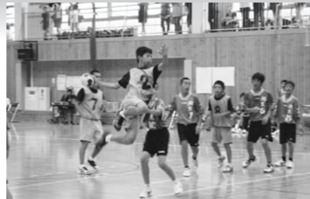
▲シュートを放つ都呂々中