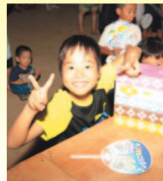
楽しい抽選会(志岐)