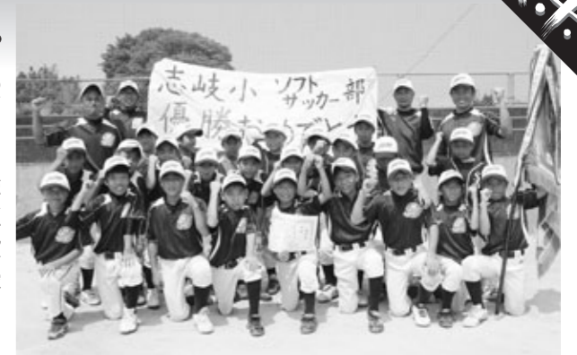
▲志岐小ソフト・サッカー部の皆さん

第42回オール天草小学生ソフトボール五和大会が7月12日・13日、五和町で開催され、志岐小学校ソフト・サッカー部が優勝しました。大会には、天草2市1町の小学生34チームが出場。そのうち志岐小は魚貫小、本渡東小と並み居る強豪を降して勝ち進み、決勝戦で天草小と対戦しました。1点を争う緊迫した戦いとなった決勝戦では、ピッチャーの好投と堅い守りを見せた志岐小が3-0で相手を降し、優勝の栄冠に輝きました。試合終了の瞬間、優勝を喜び子どもたちと応援者の声が会場に響き渡りました。