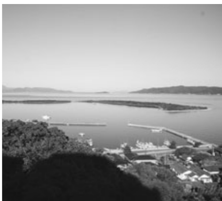
⑤ 【富岡の砂州・砂嘴】

天草地域最大規模の炭鉱として採炭されていた。炭鉱地から港まで石炭運搬用の機関車が走る天草で唯一の鉄道だった。この台座は、かつての久恒炭業志岐炭鉱入場門の安全祈願鐘の土台。