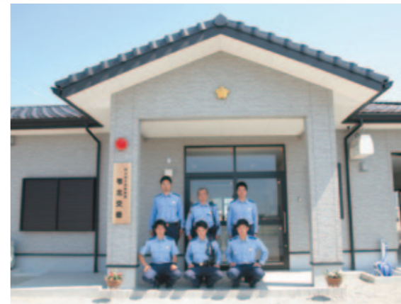
新築された「苓北交番」

お盆の恒例イベントが各地で開催されました。上津深江地区では8月13日、上津深江分校跡地において、志岐地区では14日に志岐小学校グラウンドにおいてそれぞれ盆踊り大会が開催され、ゲームやお楽しみ抽選会などでにぎわいました。また、坂瀬川地区では8月14日、坂瀬川ペーロン大会“盆決戦”が坂瀬川漁港で開催されました。地域の皆さんと帰省客と一緒に楽しめるイベントとして始まった本大会も今年で20回目。大会には、地元の皆さんをはじめお盆の帰省客を交えた9チーム約250人が参加して熱戦を繰り広げました。そのうち昨年優勝の西川内チームと準優勝の川向チームが今年も決勝レースに進出。前回と同一カードの対戦となった決勝では、雪辱に燃える川向チームを西川内チームが抑え、9回目の優勝を果たしました。