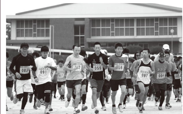
▲昨年のタヤけマラソンのスタート