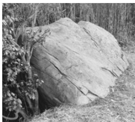
かこうせんりょくがん ③ 【花崗閃緑岩】

ジオパーク内の見所のことです。ジオサイトの多くは、素晴らしい地形や地層などが存在する場所にあります。また、ジオサイトには人々の歴史的遺産や文化遺産なども含まれます。