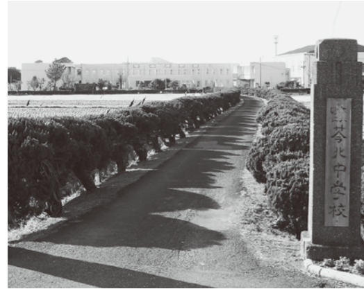
平成27年4月から町内全中学生が通う苓北中学校 ※現在、統合へ向けて校舎内外の改修工事を行っています。