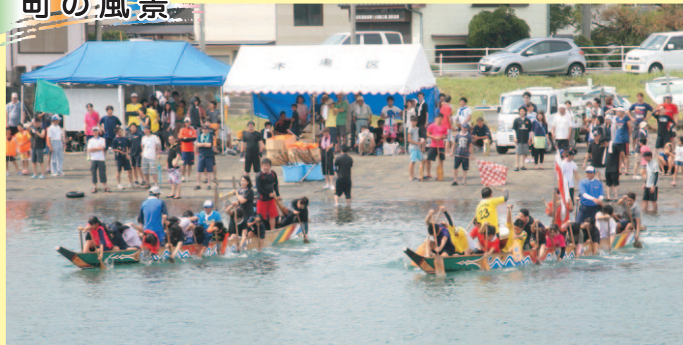
ペーロンでにぎわう坂瀬川漁港