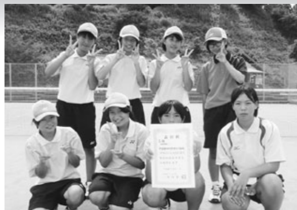
▲女子団体3位の苅北・坂瀬川中合同チーム