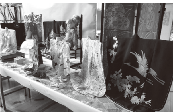
▲平成22年開催の産業文化祭の展示作品