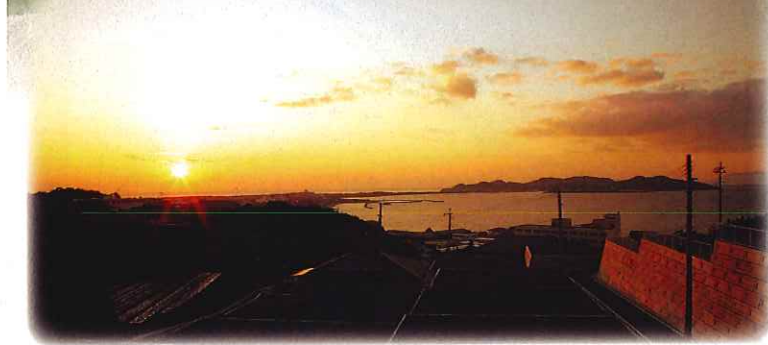
(分譲地から富岡半島の夕陽を望む)