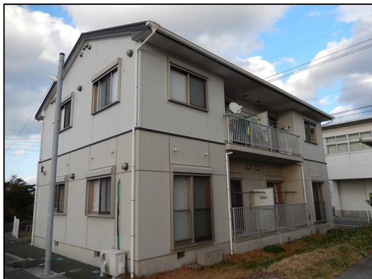
1F低層耐火構造+2F木造（ベランダ側）