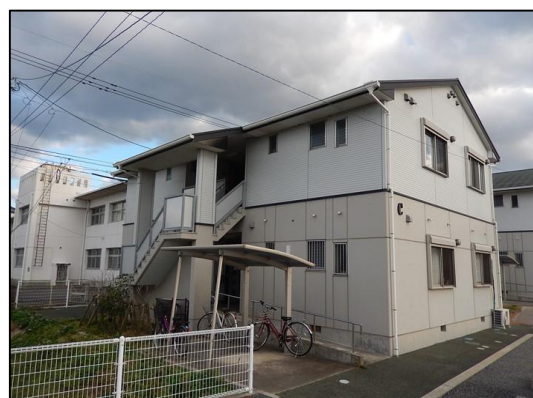
1F低層耐火構造+2F木造（階段側）